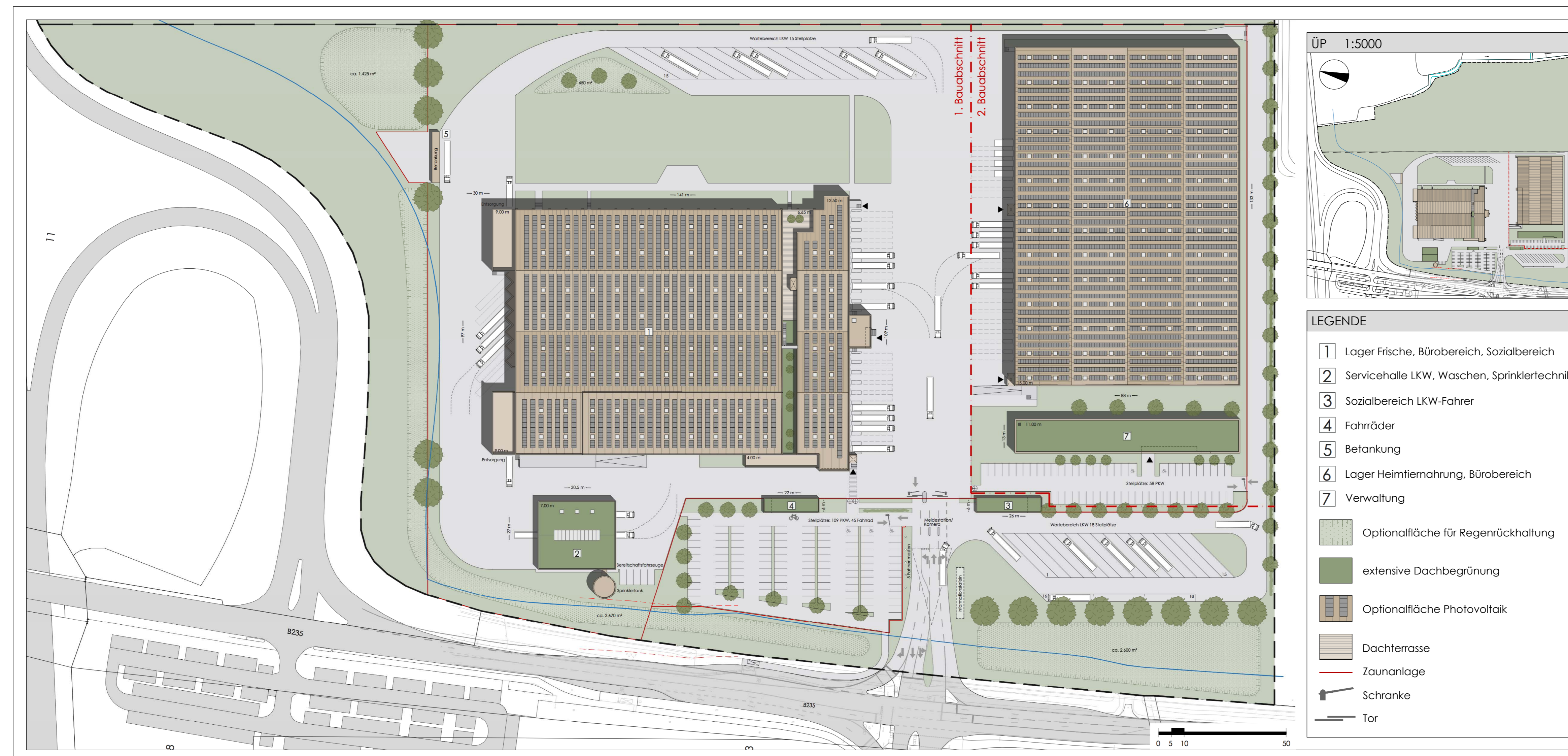
Vorhaben- und Erschließungsplan Maßstab 1:1.000