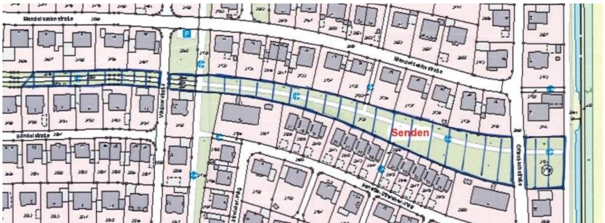
Übersichtsplan Nr. 2

Gem. § 6 Straßen- und Wegegesetz des Landes Nordrhein-Westfalen (StrWG NRW) in der derzeit gültigen Fassung ergeht folgende