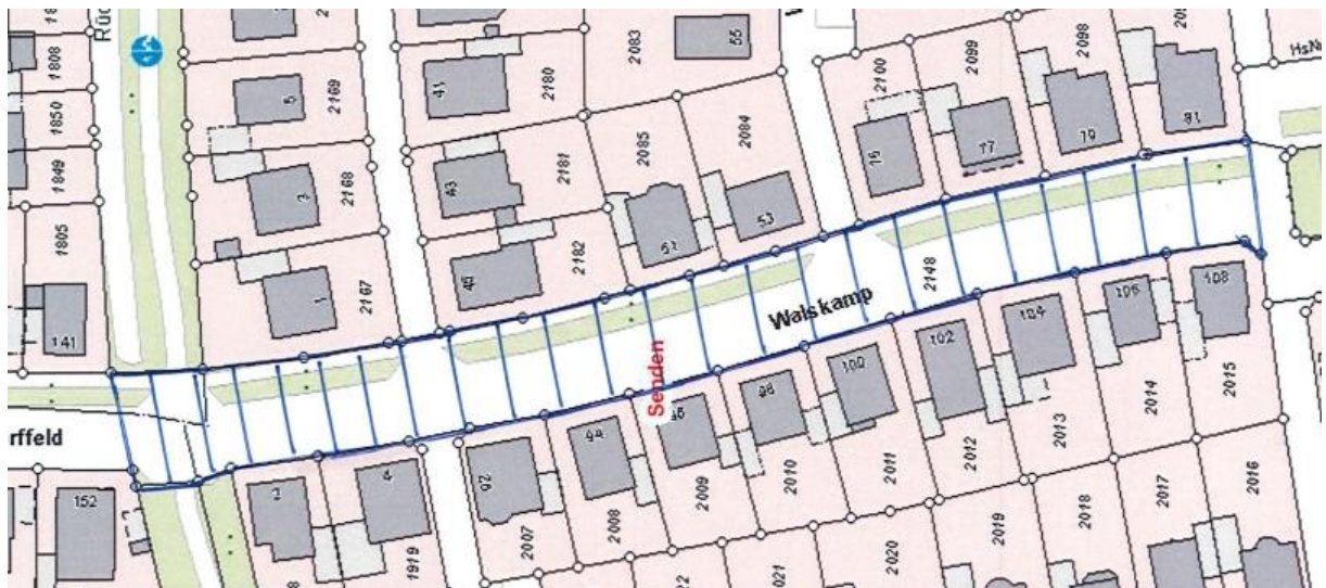
Übersichtsplan Nr. 7

Gem. § 6 Straßen- und Wegegesetz des Landes Nordrhein-Westfalen (StrWG NRW) in der derzeit gültigen Fassung ergeht folgende