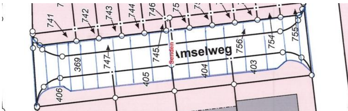
Übersichtsplan Nr. 1

Gem. § 6 Straßen- und Wegegesetz des Landes Nordrhein-Westfalen (StrWG NRW) in der derzeit gültigen Fassung ergeht folgende