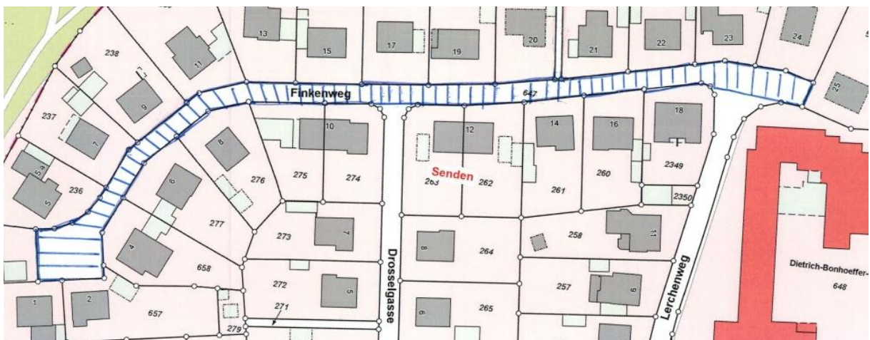
Übersichtsplan Nr. 2

Gem. § 6 Straßen- und Wegegesetz des Landes Nordrhein-Westfalen (StrWG NRW) in der derzeit gültigen Fassung ergeht folgende