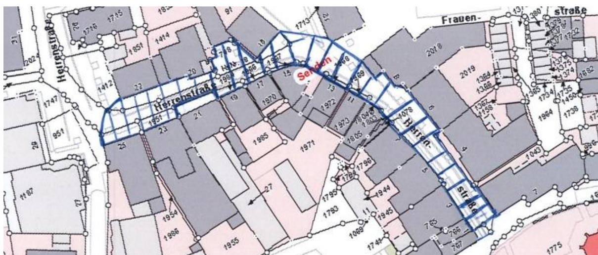
Übersichtsplan Nr. 3

Gem. § 6 Straßen- und Wegegesetz des Landes Nordrhein-Westfalen (StrWG NRW) in der derzeit gültigen Fassung ergeht folgende