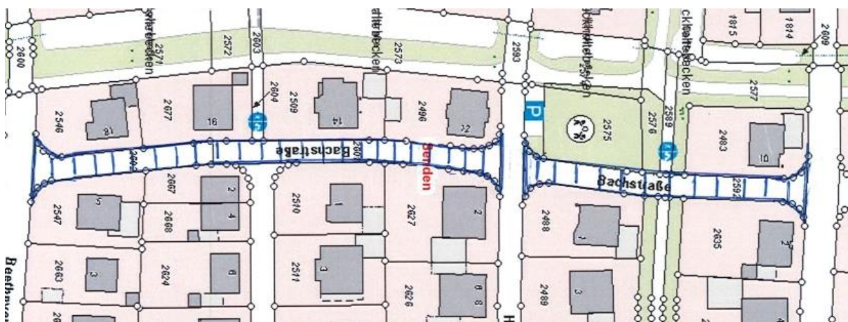
Übersichtsplan Nr. 5

Gem. § 6 Straßen- und Wegegesetz des Landes Nordrhein-Westfalen (StrWG NRW) in der derzeit gültigen Fassung ergeht folgende