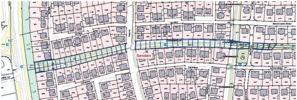
Übersichtsplan Nr. 1