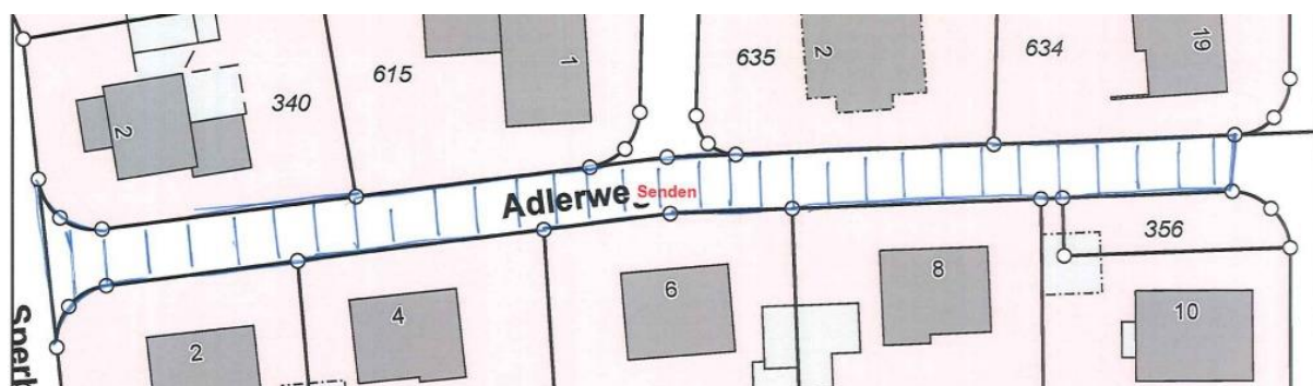
Übersichtsplan Nr. 1

Gem. § 6 Straßen- und Wegegesetz des Landes Nordrhein-Westfalen (StrWG NRW) in der derzeit gültigen Fassung ergeht folgende