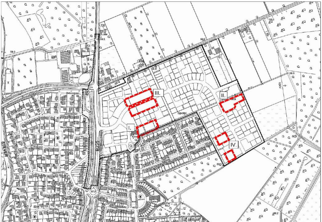
Übersichtsplan Geltungsbereich der Bebauungsplanänderung

hier: Frühzeitige Beteiligung der Öffentlichkeit gem. § 3 Abs. 1 BauGB i. V. m. § 13 BauGB